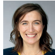
Katharina Beck MdB Finanzpolitische Sprecherin der Bundestagsfraktion Bündnis 90/Die Grünen