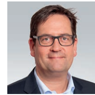
Markus Herbrand MdB Finanzpolitischer Sprecher der FDP- Bundestagsfraktion