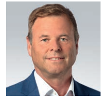
Christian Görke MdB Finanzpolitischer Sprecher der Bundestagsfraktion DIE LINKE