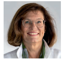
Antje Tillmann MdB Finanzpolitische Sprecherin der CDU/CSU-Bundestags- fraktion